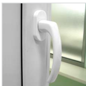
Klamka okienna FORIS

Niezlicowane skrzydło oraz listwa przyszybowa z podcięciem nadają charakterystyczny wygląd okna. Solidna konstrukcja - rama o wysokości 68 mm i głębokości zabudowy 60 mm - gwarantuje wysoką sztywność. Grubość ścianek zewnętrznych wynosząca 3 mm pozwala na tworzenie dużych konstrukcji okiennych. FORIS 100 to dobra izolacja akustyczna i termiczna. Współczynnik izolacji termicznej profili okiennych U_f = 1,6 [W/(m 2 x K)], natomiast współczynnik tłumienia R_w przy zastosowaniu standardowego pakietu szkła wynosi 30 dB. Ze względu na tradycyjne wzornictwo oraz wytrzymałość i niezawodną konstrukcję FORIS 100 jest atrakcyjny dla każdego rodzaju budownictwa.