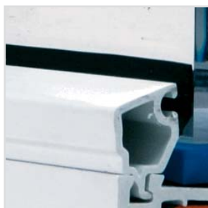
Listwa przyszybowa FORIS